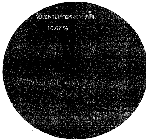
ตารางที่ ๒ แสดงร้อยละงบประมาณ จำแนกตามวิธีการจัดซื้อจัดจ้าง ประจำปีงบประมาณ พ.ศ. ๒๕๖๔