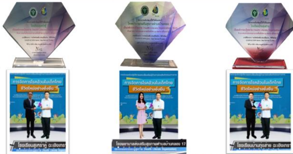
โลรางวัลองค์กรอบรมรู้สุขภาพ(Health Literate Organization) จำนวน 3 แห่ง