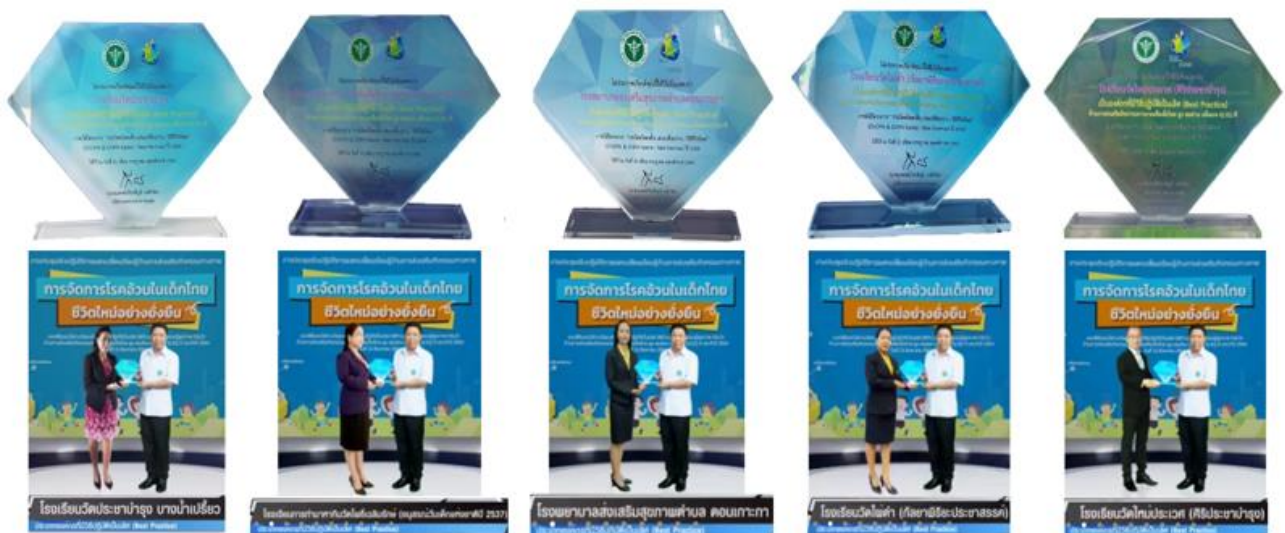
โลรางวัลองค์กรที่มีวิธิปฏิบัติเป็นเลิศ(Best Practice) จำนวน 5 แห่ง